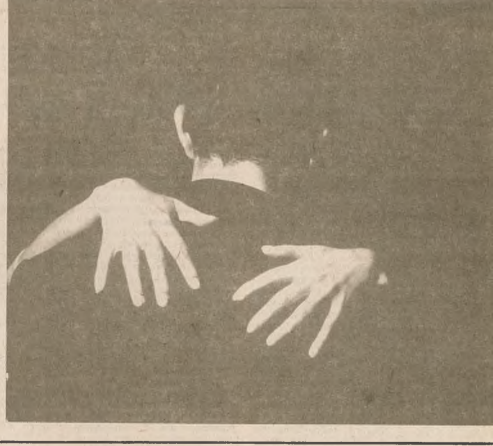
(Працяг на ст. 3).

штогадова. Вакцыны рэзка скарацілі лічбу захворванняў да 1—2-х выпадкаў у год, а ў сярэдзіне 70-х гадоў выпадкі захворванняў наогул не рэгістраваліся. Узбуджальнік дыфтэрыі гняздіцца ў ротаглотцы і з кропелькамі сліны пад час размовы, кашлю, чханьня трапляе ў успрямальны арганізм, на прадметы. Колькасць выдзеленых узбуджальнікаў узрастае ў людзей з запаленымі захворваннямі верхніх дыхальных шляхоў, ангінамі, атытамі. Таму пры паездках у гра-